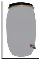
Bidón de agua, con instalación de fontanería

Una gran ventaja de la KOINE-3, es que con un único tipo de camisa y eje sinfín (ECO-STAR) proyectamos tanto morteros premezclados, como yesos y monocapas