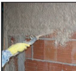
Ideal para proyectar morteros premezclados, yesos y monocapas