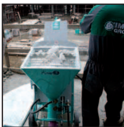
Tolva rompesacos de acero inoxidable. Se suministra siempre de serie